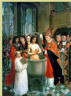
Baptême de Clovis

Le roi des Francs, Clovis, attaqua en 507 les Wisigoths et conquiert Toulouse. Clovis avait été converti, par son mariage avec Clotilde, au christianisme. Si les Wisigoths ont été très ébranlés par l'attaque des Francs, ils conservèrent Carcassonne dont ils renforcèrent les fortifications. Ils étaient alors maîtres d'une région s'étendant de Carcassonne à Narbonne alors capitale de la Septimanie*. La conversion du roi des Wisigoths, Récard, au christianisme, renforça sa puissance.