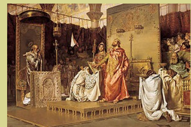
Conversion de Récard Ier

Lorsqu'au début du VIII ème siècle les Sarrazins envahirent la région, Francs et Wisigoths, pour la plupart, firent front commun contre l'ennemi. Les Sarrazins menèrent de longues et